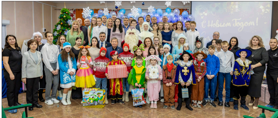
Воспитанники Лениногорского детского дома со старшими друзьями – нефтяниками

Сотрудники «Татнефти» исполнили мечты воспитанников Лениногорского детского дома