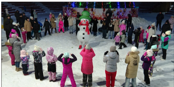
Ребята вместе со сказочными персонажами участвуют в конкурсах

Дом Деда Мороза, куда поселился Кузя, распахнул двери для всех желающих. Каждый мог сфотографироваться с новогодним волшебником и получить от него сладости и мандарины. Праздник прошел ярко и незабываемо, подарил детям хорошее настроение, новых друзей и укрепил веру в то, что добро всегда побеждает.